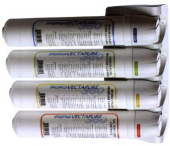
Osmose Inverse Quatre Inclus Quincaillerie et Réservoir V3604RO