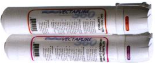
Système Filtration Double Sédiment et Charbon V3602SC