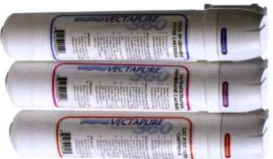
Système Ultrafiltration Triple Aucun Rejet et Réservoir V3603UF